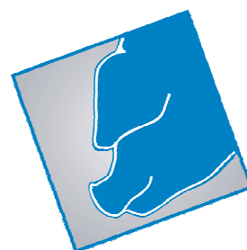
Co2 procent i valle